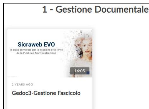
Figura 3 video corso "Gestione Fascicolo"

La formazione di un nuovo fascicolo informatico avviene attraverso l’operazione di "apertura di nuovo fascicolo" che consente di registrare nel sistema documentale le seguenti informazioni: